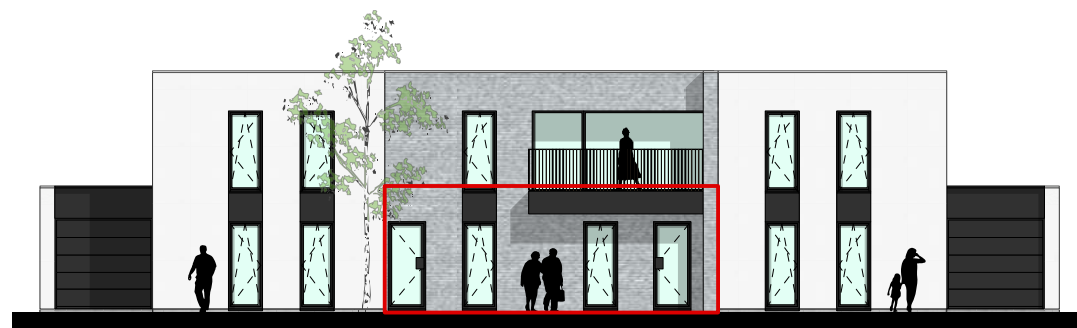
voorgevel in overzicht